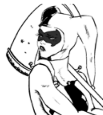
Fanart de harley quinn

Poderían partir dunha idea parecida, pero a execución da obra dá resultados distintos, como podemos ver na seguinte imaxe.